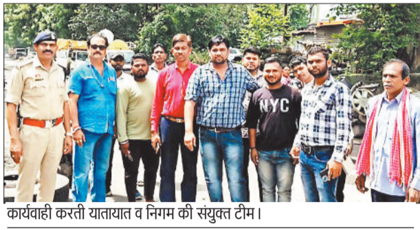
कार्यवाही करती यातायात व निगम की संयुक्त टीम।

उल्लेखनीय है कि आयुक्त आशुतोष पाण्डेय के सतत मार्गदर्शन में शहर की व्यवस्थाओं की दुरुस्तगी, अतिक्रमण व अवैध कब्जे से मुक्ति एवं साफ-सफाई हेतु निगम की एक्शन टीम लगातार कार्यवाही कर रही है। निगम आयुक्त श्री पाण्डेय स्वयं सुबह-सुबह शहर का भ्रमण कर व्यवस्थाओं का निरीक्षण करते हुए समस्याओं के निराकरण एवं शहर की व्यवस्था को पट्टी पर लाने का प्रयास कर रहे हैं। वहीं उनके कुशल मार्गदर्शन में एक ओर जहां निगम के सभी 7 जोन के जोन कमिश्नर सुबह 7 बजे से अपने-अपने जोन की टीम को लेकर वाई व बस्तियों में दस्तक देते हुए