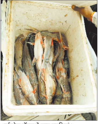
थर्मकोल बॉक्स में जप्त मछलियां।

अंबिकापुर एवं अन्य जिलों से यात्री बस से बिना किसी वैध दस्तावेज के मछलियों की तस्करी के मामले में मत्स्य विभाग के विभागीय टीम के द्वारा सोमवार को गोपालपुर में कार्यवाही की गई। जिसमें यात्री बस में थर्मकोल के बड़े कार्टून में मछलियों को रखा गया था। जांच के दौरान मछली का वास्तविक खरीदार नहीं आने के कारण उसे जप्त करने की वैधानिक कार्यवाही की गई। मत्स्य विभाग के द्वारा जिले के ग्रामीण अंचलों के जलाशयों में