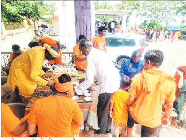
कटघोरा नगर में भोग वितरण करते हुए।