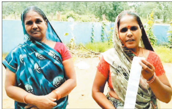
बिल को दिखाती महिला।