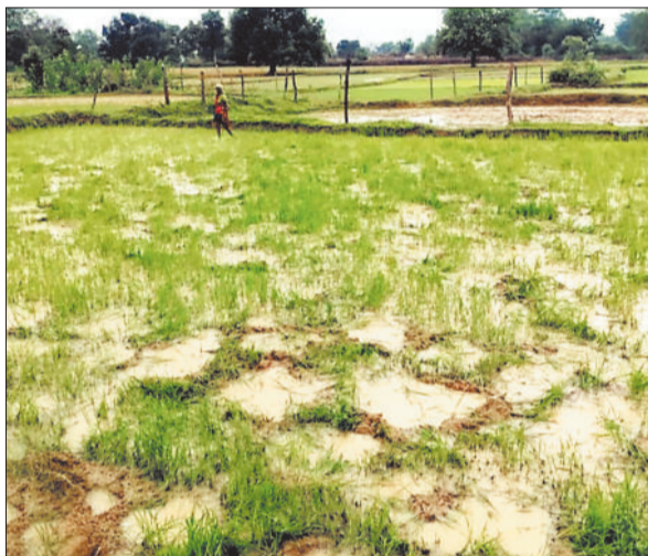
हाथियों द्वारा राँदी गई फसल।

जिले में दूरस्थ वनांचल क्षेत्र के गांव में बसने वाले ग्रामीणों की मुश्किलें कम होने का नाम नहीं ले रही है। हाथी और मानव द्वंद बढ़ता ही जा