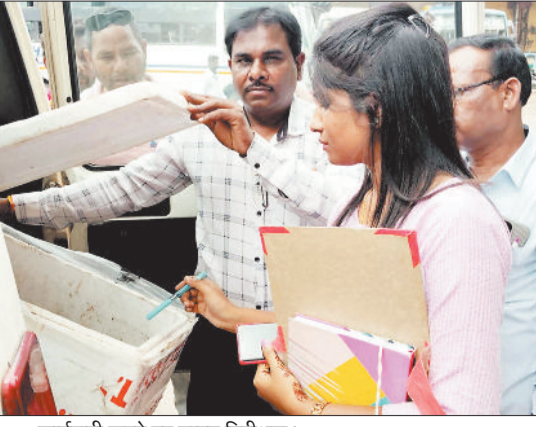
कार्यवाही करते हुए मत्स्य निरीक्षक।

मछली बीज उत्पादन के लिए बीज डाले गए हैं और उनमें शिकार को प्रतिबंधित किया गया है। 15 जून से