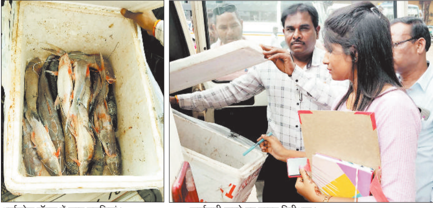
थर्मकोल बॉक्स में जप्त मछलियां।

अंबिकापुर एवं अन्य जिलों से यात्री बस से बिना किसी वैध दस्तावेज के मछलियों की तस्करी के मामले में मत्स्य विभाग के विभागीय टीम के द्वारा सोमवार को गोपालपुर में कार्यवाही की गई। जिसमें यात्री बस में थर्मकोल के बड़े कार्टून में मछलियों को रखा गया था। जांच के दौरान मछली का वास्तविक खरीदार नहीं आने के कारण उसे जप्त करने की वैधानिक कार्यवाही की गई। मत्स्य विभाग के द्वारा जिले के ग्रामीण अंचलों के जलाशयों में